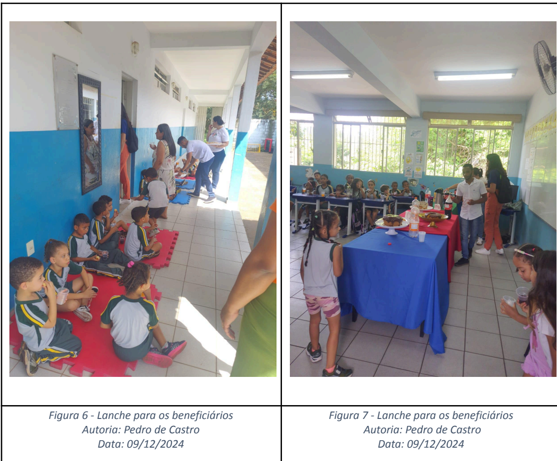
Figura 6 - Lanche para os beneficiários Data: 09/12/2024