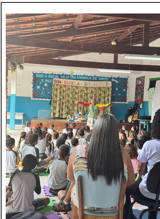
Figura 4 - Apresentação Teatral Autoria: Pedro de Castro Data: 09/12/2024

escolar do projeto, incentivando o desenvolvimento de valores e práticas relacionadas aos temas discutidos.