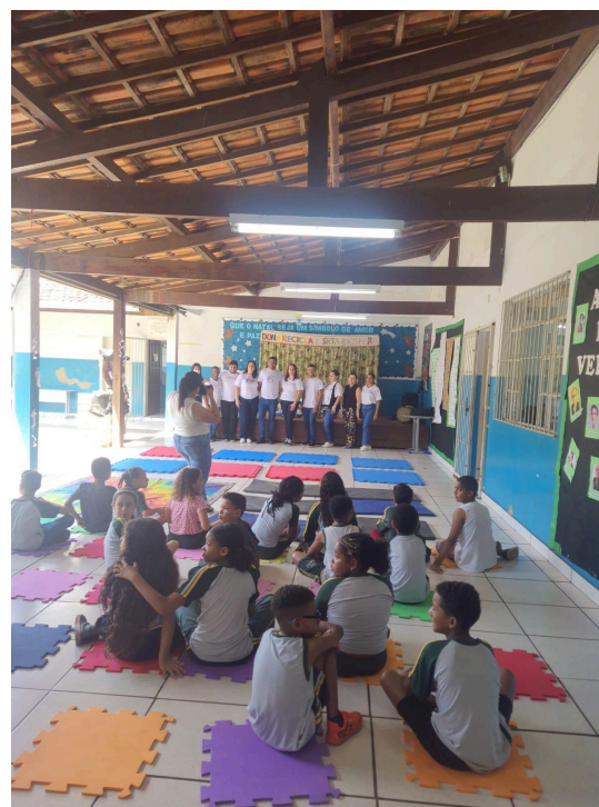
Figura 5 - Apresentação Teatral Autoria: Pedro de Castro Data: 09/12/2024

Ao final das atividades, foi oferecido um lanche aos alunos da escola, proporcionando um momento de descontração e convivência. A iniciativa reforçou o clima acolhedor do evento e deixou uma impressão positiva nos participantes.